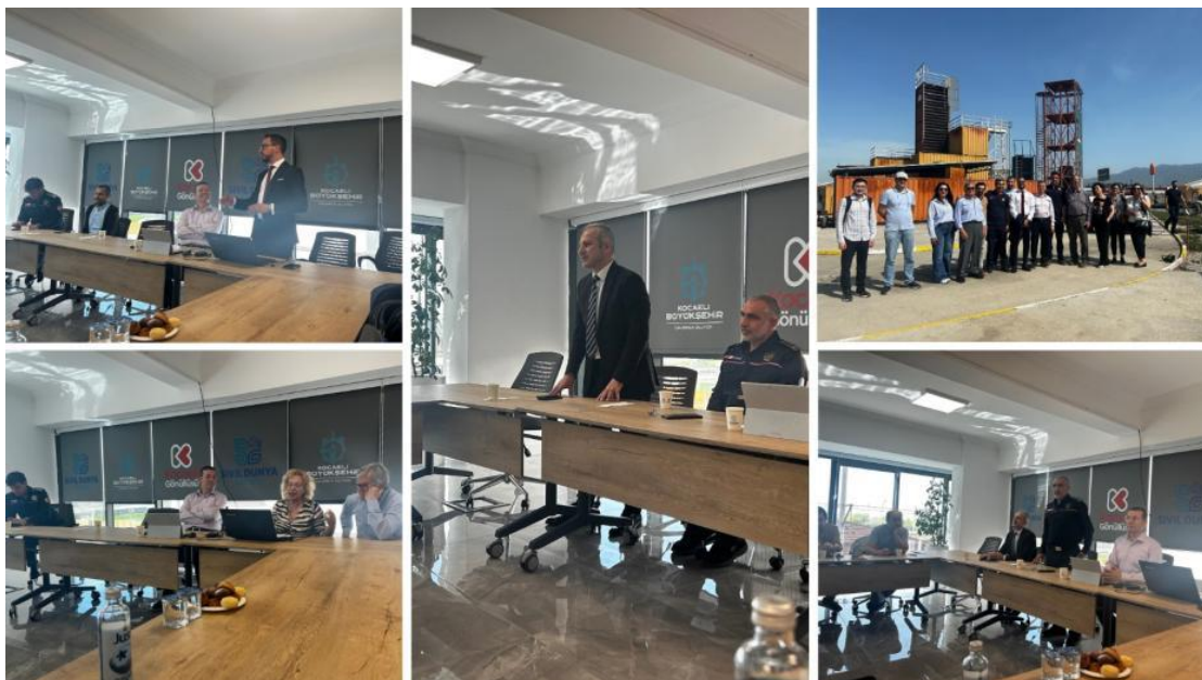
Foto dell'evento internazionale READY4Disasters in Turchia