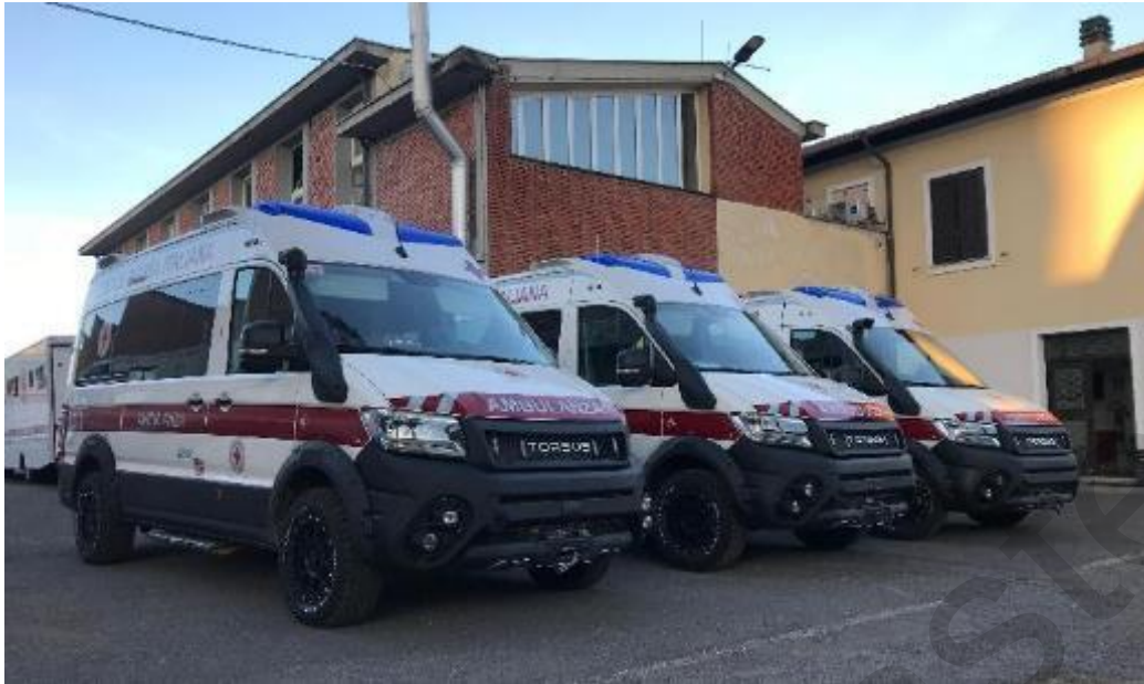
Figura 5.25 . Ambulanze speciali per il soccorso in caso di alluvioni.