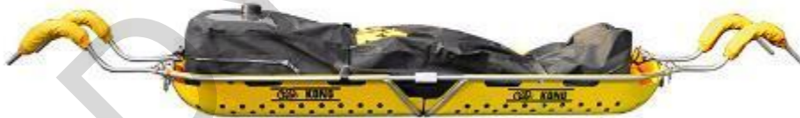
Figura 5.34. Barella a spalla.

Tavola spinale: una tavola spinale, nota anche come tavola spinale, è un dispositivo medico rigido, lungo e piatto utilizzato per immobilizzare individui con sospette lesioni spinali. In genere è realizzato con materiali leggeri ma resistenti come plastica o materiali compositi. Cinghie o imbracature vengono utilizzate per fissare il paziente alla tavola mantenendo la colonna vertebrale allineata. Le tavole spinali sono comunemente utilizzate durante l'estricazione e il trasporto di pazienti traumatizzati per prevenire ulteriori danni alla colonna vertebrale.