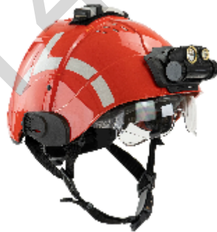
Figura 5.16 . Casco di sicurezza.

Giubbotto di salvataggio: un giubbotto di salvataggio, noto anche come giubbotto di salvataggio o salvagente, è un pezzo fondamentale dell'attrezzatura di sicurezza in acqua progettata per mantenere una persona a galla e la testa fuori dall'acqua, anche se è priva di sensi. I giubbotti di salvataggio sono disponibili in vari stili, compresi i modelli imbottiti in schiuma, gonfiabili e ibridi. Sono caratterizzati dalla loro elevata galleggiabilità e spesso includono un collare o un supporto per la testa per mantenere la testa di chi li indossa fuori dall'acqua. I giubbotti di salvataggio forniscono un galleggiamento critico e un supporto potenzialmente salvavita in situazioni di emergenza.