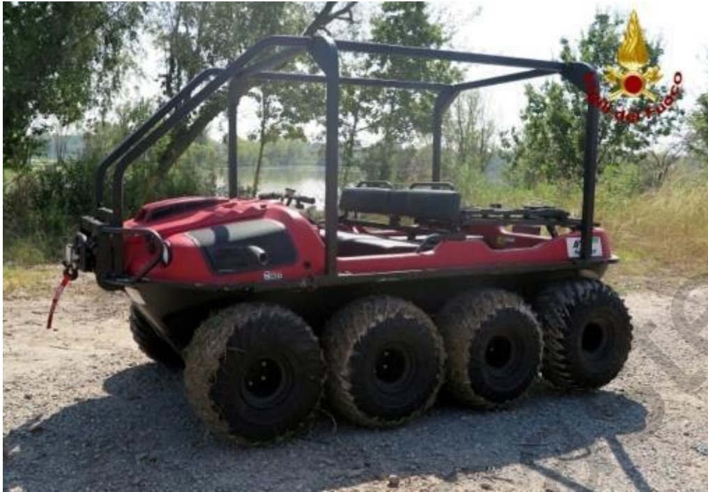
Figura 5.27 . Veicolo speciale per il salvataggio in caso di alluvioni.