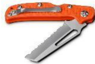
Figura 5.17 . Coltello di sicurezza.

rendendoli adatti ai professionisti del salvataggio in acqua, del kayak e di altre attività acquatiche.