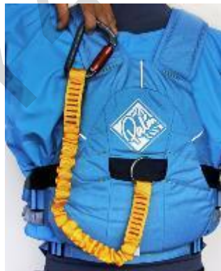
Figura 5.20 . Coda di mucca.

Palo da trampolino: i pali da trampolino possono essere realizzati con materiali naturali o artificiali. Vengono utilizzati per verificare la profondità dell'acqua e i pericoli sottomarini durante il guado. Possono essere utilizzati anche per i salvataggi dall'acqua.