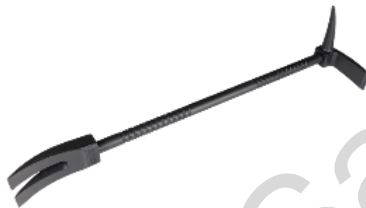
Figura 5.37. Gancio Halligan.

Gancio Halligan : il gancio Halligan, spesso chiamato barra Halligan, è uno strumento versatile per l'ingresso forzato utilizzato dai vigili del fuoco e dal personale di soccorso. Solitamente è costituito da un'estremità biforcuta, un'ascia piatta (estremità che fa leva) e un piccone o punta affusolata. Lo strumento è progettato per forzare l'apertura di porte, finestre e altre barriere in situazioni di emergenza. I vigili del fuoco lo utilizzano per accedere a edifici, veicoli e spazi confinati.