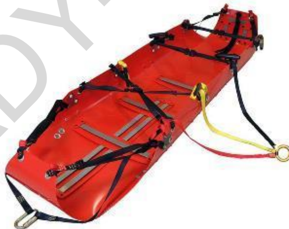
Figura 5.36. Barella a cestello.

Borsa di pronto soccorso: una borsa di pronto soccorso è un contenitore portatile progettato per contenere una varietà di forniture e attrezzature di primo soccorso per l'assistenza medica immediata. Queste borse sono disponibili in varie dimensioni e configurazioni, che vanno dai kit piccoli e compatti per uso personale ai kit più grandi e completi utilizzati dai primi soccorritori e dagli operatori sanitari. Una borsa di pronto soccorso ben attrezzata contiene in genere bende, medicazioni, antisettici, strumenti medici e altri materiali per il trattamento di lesioni ed emergenze mediche.