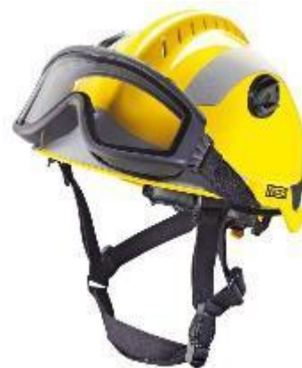
Figura 5.29 . Casco di salvataggio.

Una tuta di salvataggio , indossata dai vigili del fuoco e dal personale di soccorso, è un equipaggiamento protettivo specializzato progettato per le operazioni di estricazione e salvataggio dei veicoli in ambienti pericolosi. Realizzato con materiali durevoli come il