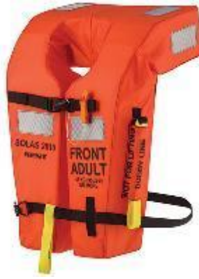
Figura 5.15 . Giubbotto di salvataggio.

Giubbotto di salvataggio: un giubbotto di salvataggio, noto anche come giubbotto di salvataggio o salvagente, è un pezzo fondamentale dell'attrezzatura di sicurezza in acqua progettata per mantenere una persona a galla e la testa fuori dall'acqua, anche se è priva di sensi. I giubbotti di salvataggio sono disponibili in vari stili, compresi i modelli imbottiti in schiuma, gonfiabili e ibridi. Sono caratterizzati dalla loro elevata galleggiabilità e spesso includono un collare o un supporto per la testa per mantenere la testa di chi li indossa fuori dall'acqua. I giubbotti di salvataggio forniscono un galleggiamento critico e un supporto potenzialmente salvavita in situazioni di emergenza.