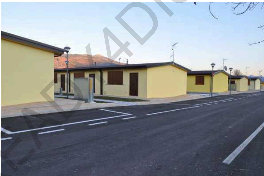
Figura 5.12 . Ricovero a lungo termine dopo il terremoto del Centro Italia 2016.