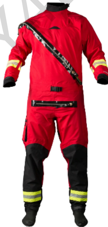
Figura 5.13 . Muta stagna per la risposta alle inondazioni.