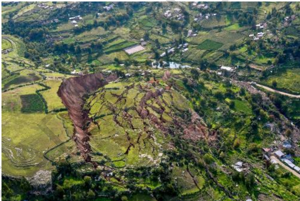
Figura 5.3 . Veduta aerea di una frana.

La partecipazione della comunità è altrettanto importante nella pianificazione delle frane. comunità è della massima importanza. È essenziale informare i residenti sui rischi di alluvioni, sui sistemi di allarme rapido e sui protocolli di evacuazione. Questo approccio proattivo può portare a una diminuzione del numero di persone che necessitano di soccorso durante un evento alluvionale e favorire una maggiore resilienza all'interno della comunità. Inoltre, coinvolgere i leader e le organizzazioni della comunità nella fase di pianificazione può migliorare la collaborazione e il coordinamento durante le situazioni di emergenza.