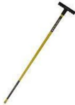
Figura 5.19 . Polo da trampolino.

essenziali per mantenere un appoggio sicuro e proteggere i piedi durante le operazioni di salvataggio in acqua.