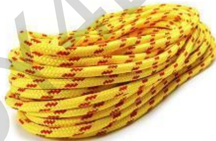
Figura 5.22 . Corda per il salvataggio in acqua.

Un sacco da lancio è costituito da un pezzo di corda (una linea da lancio) riposto all'interno di un sacco a sgancio rapido. Viene utilizzato per salvare le vittime nell'acqua in movimento. Si raccomanda che chiunque lavori nell'ambiente inondato abbia accesso a un sacco da lancio. Corda dai colori vivaci che galleggerà in quanto ciò aiuterà la vittima e il soccorritore a vedere la corda sulla superficie dell'acqua.