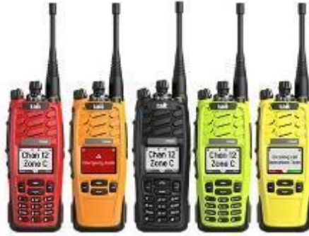
Figura 5.23 . Radio impermeabili

Le imbarcazioni per la risposta alle alluvioni sono imbarcazioni specializzate utilizzate dai soccorritori e dalle squadre di gestione delle catastrofi per fornire assistenza e svolgere vari compiti durante le emergenze legate alle inondazioni. Queste imbarcazioni sono progettate per navigare attraverso le acque alluvionali ed eseguire operazioni di salvataggio e soccorso. Ecco alcune caratteristiche chiave e tipi di imbarcazioni per la risposta alle inondazioni: