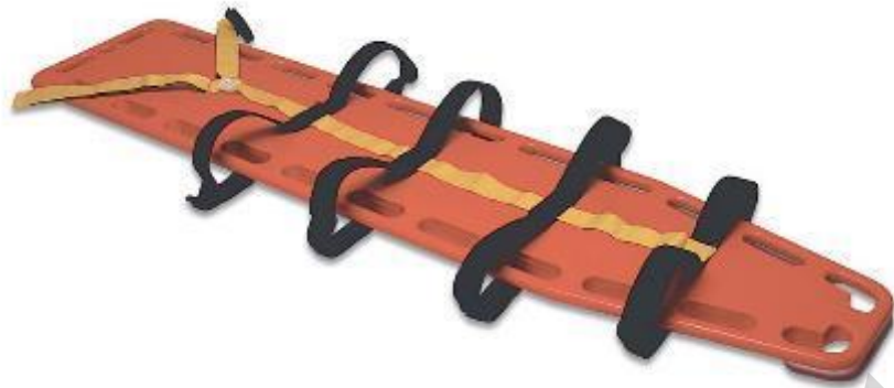
Figura 5.33. Tavola spinale.

Tavola spinale: una tavola spinale, nota anche come tavola spinale, è un dispositivo medico rigido, lungo e piatto utilizzato per immobilizzare individui con sospette lesioni spinali. In genere è realizzato con materiali leggeri ma resistenti come plastica o materiali compositi. Cinghie o imbracature vengono utilizzate per fissare il paziente alla tavola mantenendo la colonna vertebrale allineata. Le tavole spinali sono comunemente utilizzate durante l'estricazione e il trasporto di pazienti traumatizzati per prevenire ulteriori danni alla colonna vertebrale.