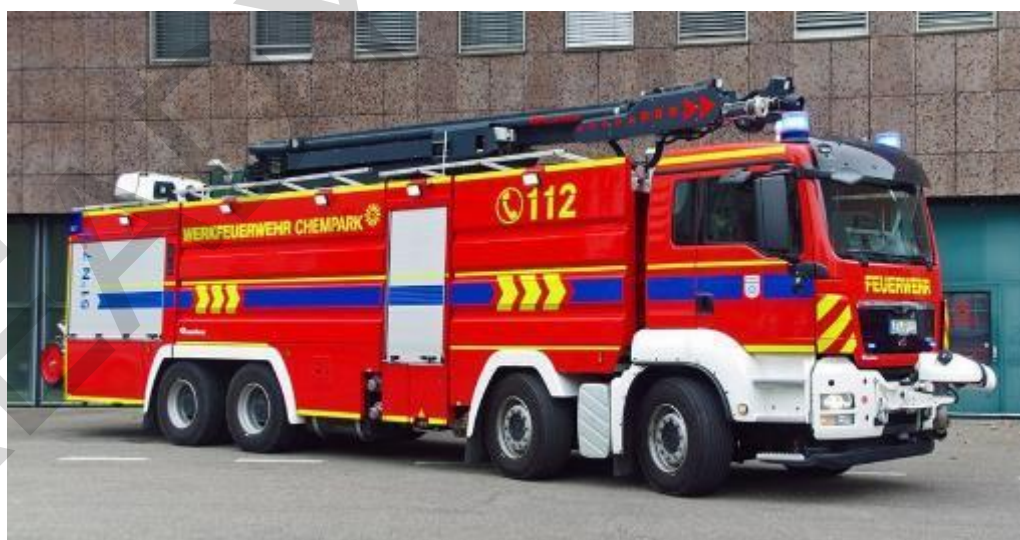
Figura 5.43. Autopompa antincendio industriale.

Un'autoscala antincendio , spesso nota come autoscala aerea o società di scale, è un veicolo antincendio specializzato dotato di una scala estensibile utilizzata per accedere ad aree elevate ed eseguire soccorsi. È dotato di una cabina spaziosa, sirene e luci per la risposta alle emergenze. La scala estensibile, spesso con cestello o piattaforma, aiuta nelle operazioni antincendio, di ricerca e salvataggio e nell'accesso ai grattacieli. Questi camion possono anche trasportare attrezzature antincendio, strumenti e sistemi di comunicazione. Le autoscale antincendio svolgono un ruolo cruciale negli scenari di soccorso e antincendio urbani, offrendo portata critica e versatilità in situazioni di emergenza.