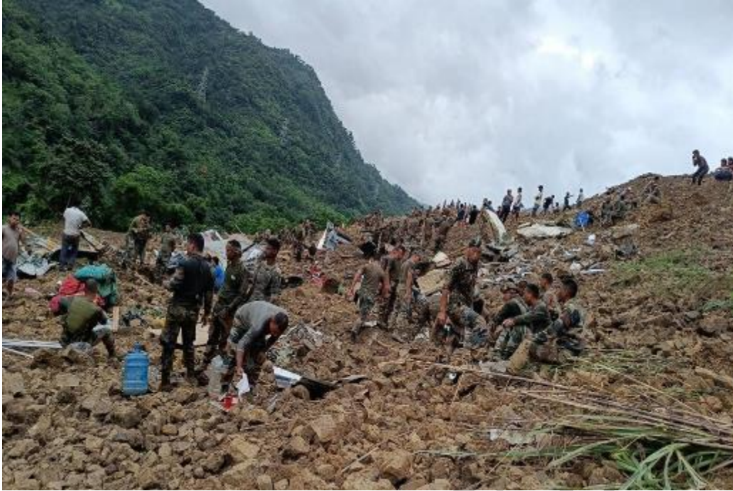
Figura 5. 5. Ricerca e soccorso dopo una frana.