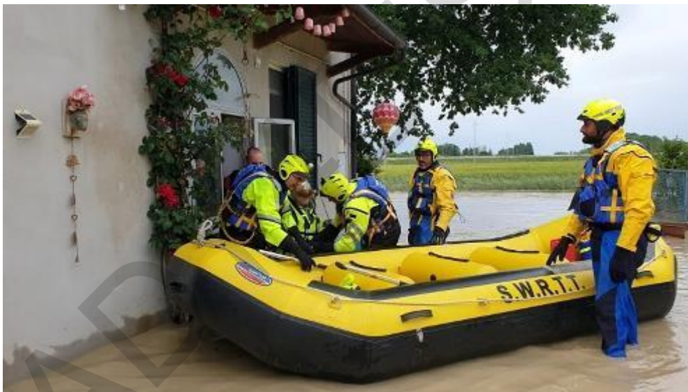
Figura 5.2 . Operazioni SAR dopo le alluvioni dell'Emilia Romagna, Italia 2023.