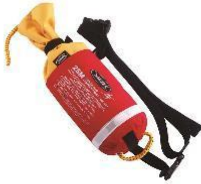
Figura 5.21 . Sacco da lancio.

Un sacco da lancio è costituito da un pezzo di corda (una linea da lancio) riposto all'interno di un sacco a sgancio rapido. Viene utilizzato per salvare le vittime nell'acqua in movimento. Si raccomanda che chiunque lavori nell'ambiente inondato abbia accesso a un sacco da lancio. Corda dai colori vivaci che galleggerà in quanto ciò aiuterà la vittima e il soccorritore a vedere la corda sulla superficie dell'acqua.