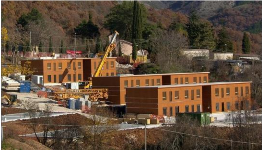
Figura 5.11 . Ricovero a lungo termine dopo il terremoto del Centro Italia 2016.