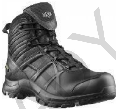
Figura 5.30. Scarpe antinfortunistiche

Un elmetto di sicurezza per operazioni di soccorso, diverso dagli elmetti antincendio, è un elemento cruciale dei dispositivi di protezione individuale (DPI) progettato per salvaguardare la testa durante vari scenari di salvataggio. Questi caschi sono in genere leggeri e resistenti, costruiti con materiali come plastica ABS ad alto impatto o fibra di vetro. Sono dotati di un sistema di sospensione regolabile per una vestibilità sicura, spesso con interni imbottiti per il massimo comfort. I caschi possono includere una protezione per gli occhi integrata, come una visiera o occhiali protettivi, per proteggere gli occhi da detriti e pericoli. Inoltre, spesso sono dotati di slot per il collegamento di lampade frontali o dispositivi di comunicazione, garantendo versatilità e sicurezza in diversi ambienti di soccorso.