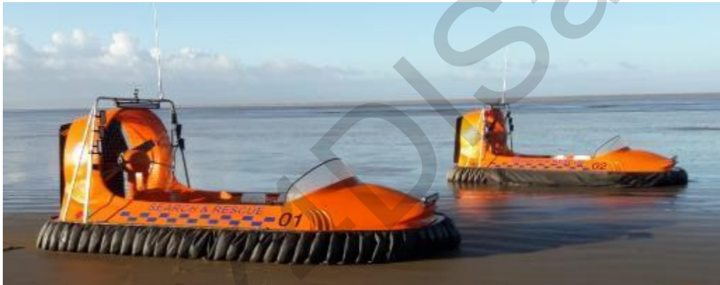
Figura 5.2 4. Barche di salvataggio.

Veicoli speciali come i veicoli anfibi vengono utilizzati per la loro capacità di operare in ambienti diversi e difficili. I veicoli anfibi possono navigare sia sulla terra che sull'acqua, il che li rende preziosi per le missioni in aree con terreno allagato o livelli dell'acqua elevati. Forniscono accesso e mobilità essenziali ai soccorritori e aiutano nelle operazioni di ricerca e salvataggio, soprattutto durante i disastri naturali come le inondazioni, dove i veicoli convenzionali possono rimanere immobilizzati in condizioni fangose o sommerse. Questi veicoli specializzati migliorano la capacità di raggiungere e assistere le persone in difficoltà, garantendo risposte di emergenza più efficaci in una varietà di scenari. Questi includono ambulanze per acque alte, ATB a 8 ruote motrici e camion anfibi.