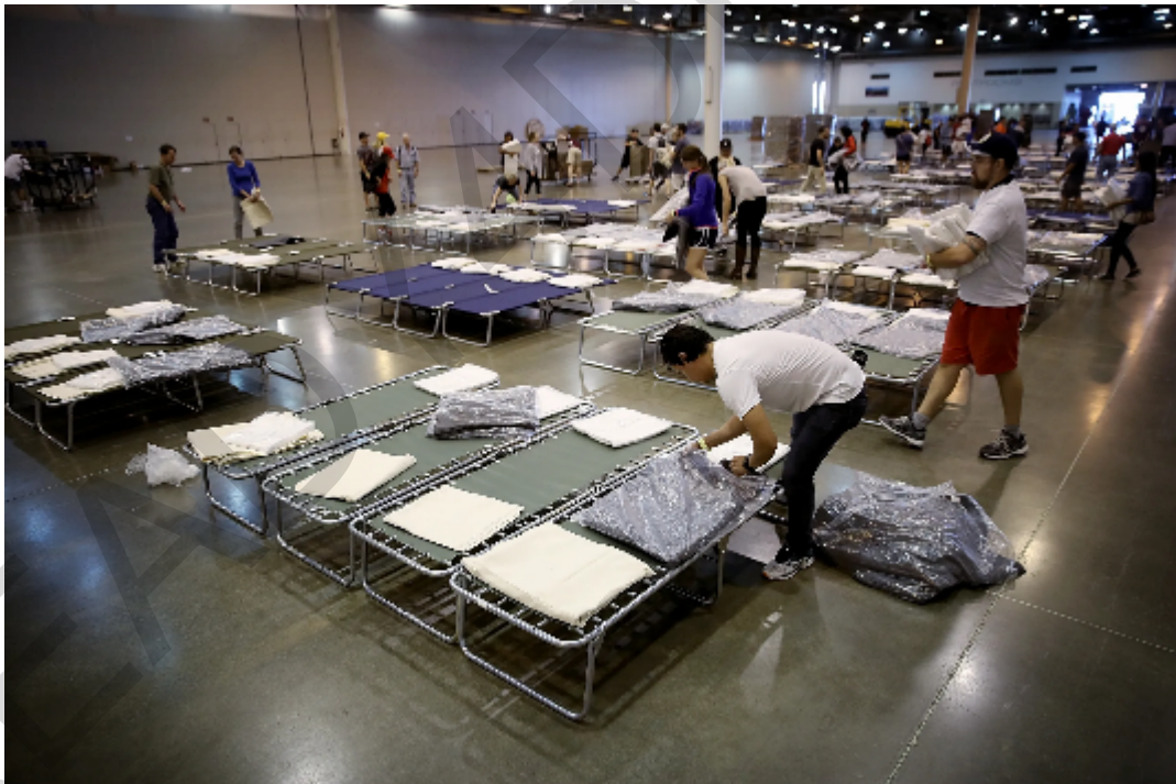
Figura 5.10 . Ricovero temporaneo in un palazzetto dello sport.