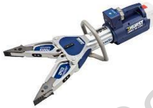
Figura 5.3 9. Divaricatore

Ascia da fuoco : un'ascia da fuoco è un'ascia specializzata progettata per le operazioni antincendio e di salvataggio. Tipicamente presenta un bordo tagliente affilato su un lato della testa e un'ascia piatta, spesso seghettata, sull'altro lato. I vigili del fuoco utilizzano il bordo affilato per tagliare, tagliare e sfondare, mentre l'ascia viene utilizzata per fare leva e separare materiali come legno, cartongesso o coperture.