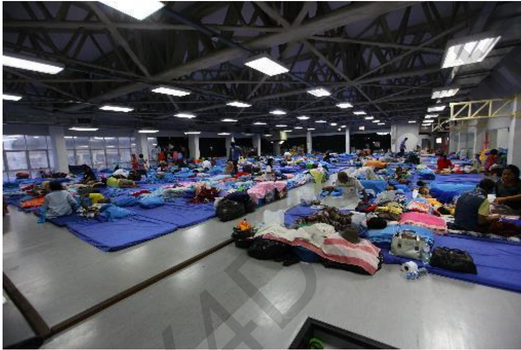
Figura 5.8 . Ricovero temporaneo in una struttura pubblica.

lungo termine, poiché potrebbero interferire con il normale funzionamento degli edifici o provocarne danni. Inoltre, potrebbero non soddisfare le esigenze o le preferenze specifiche di diversi gruppi di persone, come donne, bambini, anziani o disabili. È da notare che tali tipi di rifugi dovrebbero essere utilizzati per un periodo molto breve. Pertanto, è importante valutare l' idoneità e la sostenibilità delle infrastrutture come rifugi prima di utilizzarle e garantire che siano ben gestite e coordinate con altre organizzazioni umanitarie.