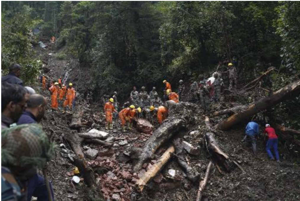
Figura 5.4 . Ricerca e soccorso dopo una frana.