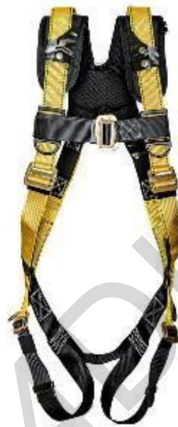
Figura 5.32. Imbracatura di sicurezza.

Guanti di sicurezza: i guanti di sicurezza per le operazioni di salvataggio sono protezioni specializzate per le mani progettate per proteggere le mani da tagli, abrasioni, sostanze chimiche e altri rischi incontrati durante le attività di salvataggio. Sono realizzati con materiali come pelle, Kevlar o miscele sintetiche per garantire durata e destrezza. Alcuni guanti possono avere palmi e dita rinforzati per una maggiore protezione. Questi guanti consentono ai soccorritori di lavorare in modo efficace mantenendo la sicurezza delle mani e la sensibilità tattile.