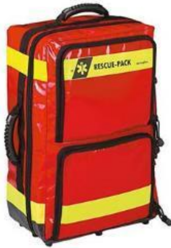
Figura 5.35 . Borsa di pronto soccorso.

Borsa di pronto soccorso: una borsa di pronto soccorso è un contenitore portatile progettato per contenere una varietà di forniture e attrezzature di primo soccorso per l'assistenza medica immediata. Queste borse sono disponibili in varie dimensioni e configurazioni, che vanno dai kit piccoli e compatti per uso personale ai kit più grandi e completi utilizzati dai primi soccorritori e dagli operatori sanitari. Una borsa di pronto soccorso ben attrezzata contiene in genere bende, medicazioni, antisettici, strumenti medici e altri materiali per il trattamento di lesioni ed emergenze mediche.