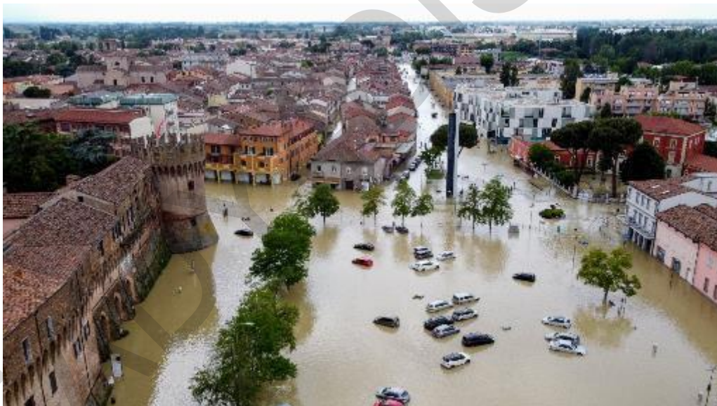
Figura 5.4 4. Veduta aerea di un paese alluvionato in Emilia Romagna.

Inoltre, i vigili del fuoco sono stati impegnati a setacciare le macerie di una casa crollata a Fontanelice a seguito di una frana, poiché si temeva che una persona potesse essere all'interno dell'abitazione al momento dell'incidente.