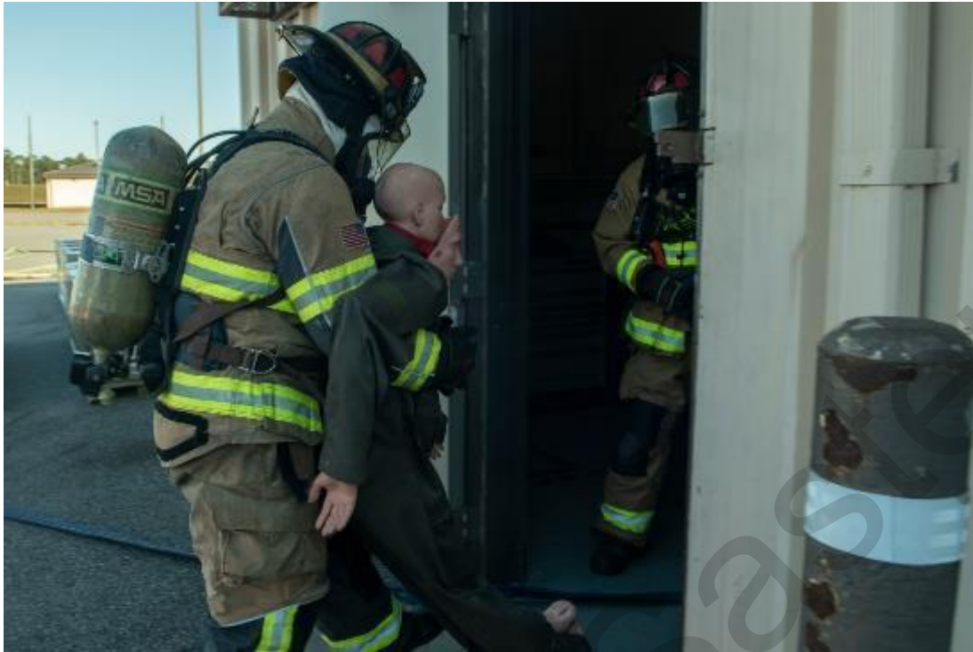
Figura 5.7 . Addestramento dei vigili del fuoco per l'evacuazione (USA).