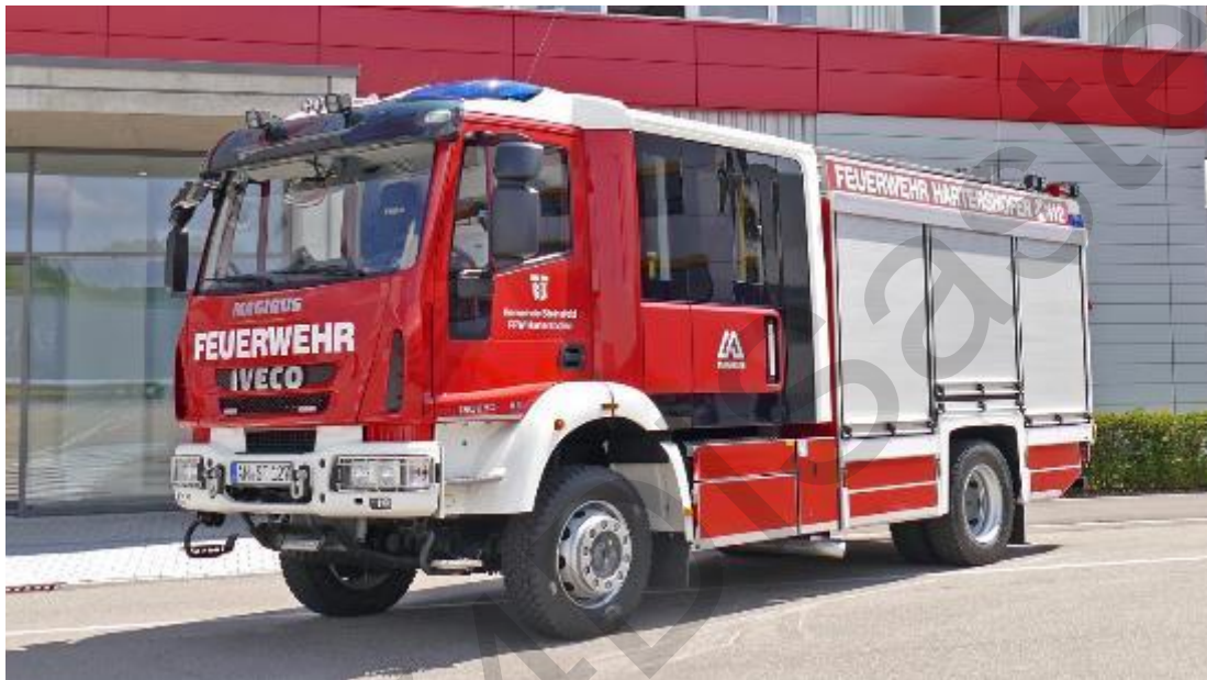
Figura 5.41 . Autopompa antincendio.

come tagliare muri, tetti e detriti per accedere alle vittime o creare aperture di ventilazione negli edifici in fiamme.