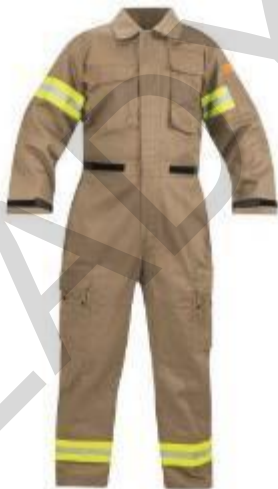
Figura 5.28 . Tuta di salvataggio.