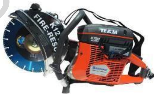
Figura 5.40. Sega K-12.

Divaricatore : le Mascelle della Vita, conosciute anche come strumenti di salvataggio idraulici o divaricatori, sono potenti strumenti idraulici utilizzati per districare le vittime dai veicoli coinvolti in incidenti, soprattutto quando sono intrappolate a causa di danni strutturali. Sono costituiti da una pompa idraulica, tubi flessibili e accessori specializzati come divaricatori (per separare i componenti del veicolo), taglierine (per tagliare il metallo) e cilindri (per sollevare o spingere oggetti). Le Fauci della Vita possono tagliare il metallo, aprire le portiere dei veicoli e fornire la forza necessaria per liberare le persone intrappolate.