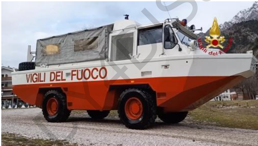
Figura 5.26 . Camion anfibio.