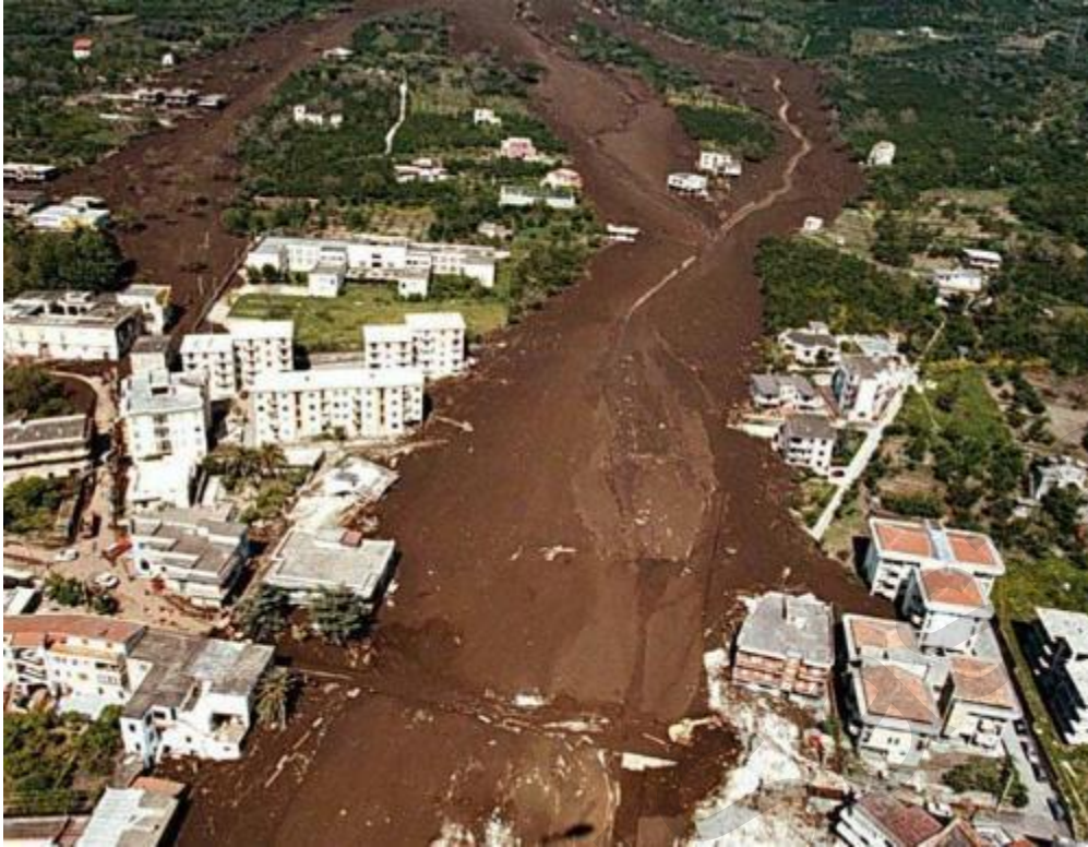
Figura 5.45. Veduta aerea di Sarno.

La frana del Sarno del maggio 1998 ha innescato una risposta rapida e urgente da parte delle autorità locali, dei servizi di emergenza e dei volontari mentre affrontavano l'enorme compito di cercare sopravvissuti in mezzo alla devastazione e fornire aiuti alla comunità colpita. Le operazioni di ricerca e salvataggio sono state caratterizzate da una combinazione di sfide poste dal terreno difficile, dai rischi di frane in corso e dall'imperativo di localizzare e assistere le persone colpite dal disastro.