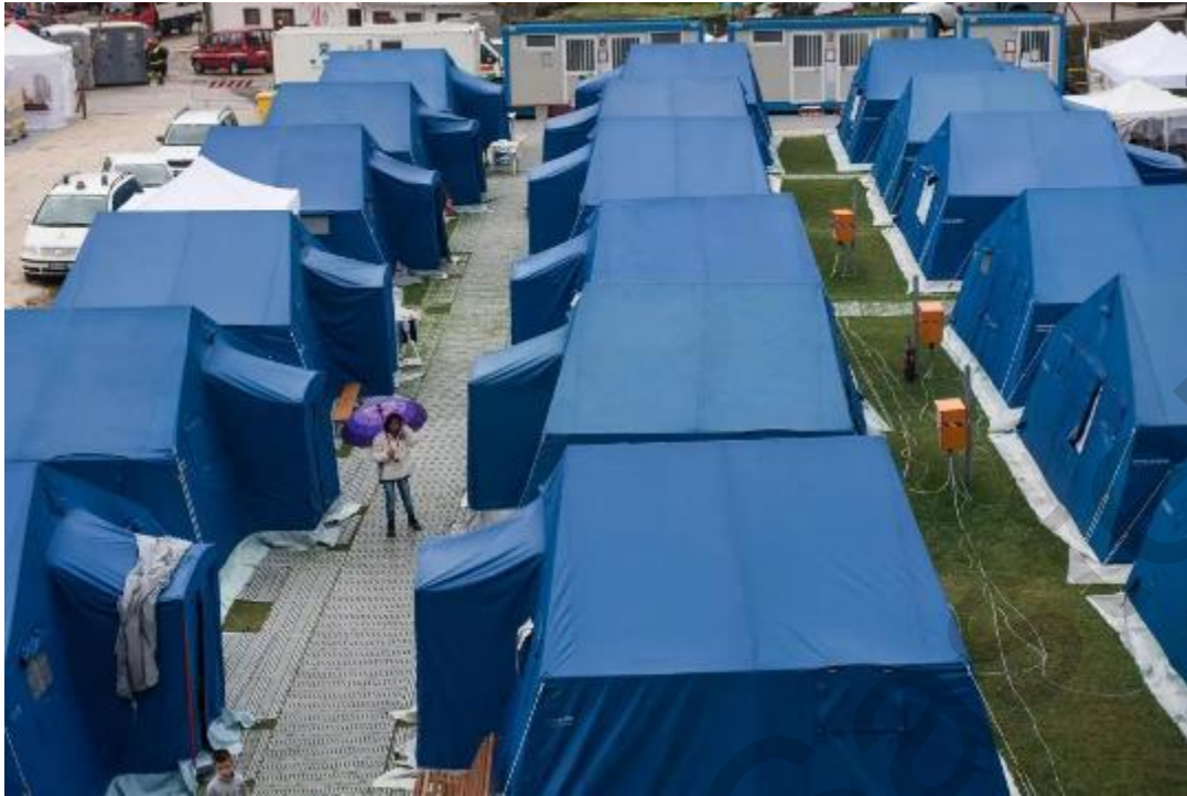
Figura 5.9 . Rifugio temporaneo in tenda, Italia.