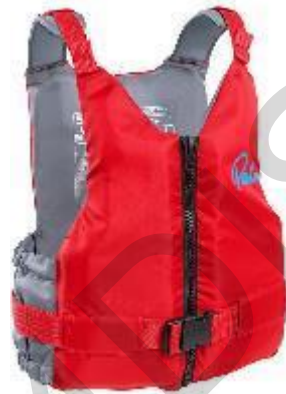
Figura 5.14 . Giacca di galleggiamento.

Muta stagna: una muta stagna per la risposta alle alluvioni è un indumento impermeabile specializzato utilizzato dai soccorritori durante le operazioni legate alle inondazioni. Costruito con materiali impermeabili come Gore-Tex o neoprene, fornisce protezione completa del corpo contro l'immersione nelle acque alluvionali. La tuta in genere include cerniere impermeabili, guarnizioni sui polsi e sul collo e stivali integrati per garantire una tenuta stagna. Anche un cappuccio e guanti in neoprene possono far parte dell'insieme. La muta stagna consente agli operatori di lavorare in sicurezza in aree allagate, proteggendoli da acqua contaminata, temperature fredde e potenziali pericoli. Si tratta di un'attrezzatura essenziale per le squadre di soccorso in acque rapide e per il personale addetto alla risposta alle inondazioni, garantendo la loro sicurezza ed efficacia in condizioni di alluvioni difficili.