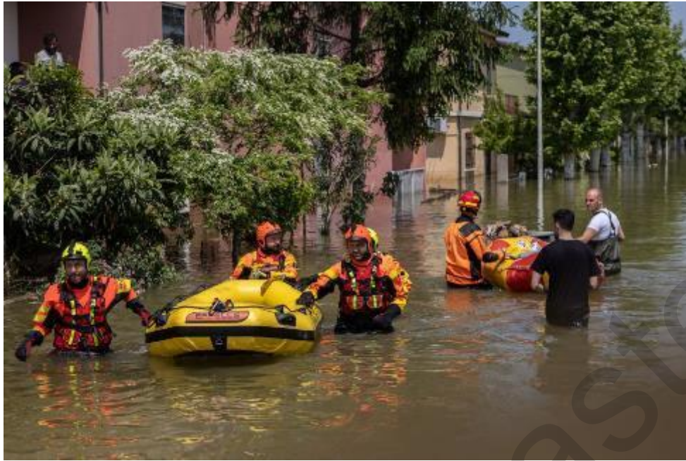
Figura 5.1 . Operazioni SAR dopo alluvioni in Emilia Romagna, Italia 2023 .