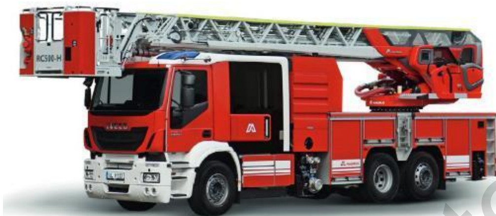
Figura 5.42. Autoscala antincendio

Un'autoscala antincendio , spesso nota come autoscala aerea o società di scale, è un veicolo antincendio specializzato dotato di una scala estensibile utilizzata per accedere ad aree elevate ed eseguire soccorsi. È dotato di una cabina spaziosa, sirene e luci per la risposta alle emergenze. La scala estensibile, spesso con cestello o piattaforma, aiuta nelle operazioni antincendio, di ricerca e salvataggio e nell'accesso ai grattacieli. Questi camion possono anche trasportare attrezzature antincendio, strumenti e sistemi di comunicazione. Le autoscale antincendio svolgono un ruolo cruciale negli scenari di soccorso e antincendio urbani, offrendo portata critica e versatilità in situazioni di emergenza.