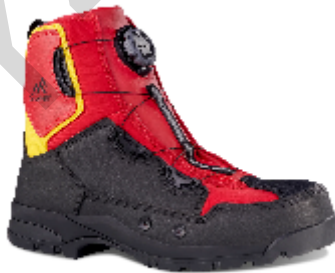
Figura 5.18 . Stivali di sicurezza per il salvataggio in acqua.

Coltello di sicurezza: un coltello di sicurezza per il salvataggio in acqua è uno strumento da taglio appositamente progettato con una lama arrotondata o incassata per prevenire lesioni accidentali a chi lo indossa o alla persona soccorsa. Questi coltelli sono comunemente usati dalle squadre di soccorso in acqua e dai kayakisti per tagliare corde, cinghie o impigliamenti in modo rapido e sicuro. Spesso presentano una punta smussata e un bordo seghettato o affilato per un taglio versatile in situazioni di emergenza.