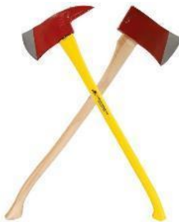
Figura 5.38 . Ascia da fuoco.

Gancio Halligan : il gancio Halligan, spesso chiamato barra Halligan, è uno strumento versatile per l'ingresso forzato utilizzato dai vigili del fuoco e dal personale di soccorso. Solitamente è costituito da un'estremità biforcuta, un'ascia piatta (estremità che fa leva) e un piccone o punta affusolata. Lo strumento è progettato per forzare l'apertura di porte, finestre e altre barriere in situazioni di emergenza. I vigili del fuoco lo utilizzano per accedere a edifici, veicoli e spazi confinati.