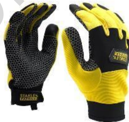
Figura 5.31. Guanti di sicurezza

Stivali di sicurezza: gli stivali di sicurezza per le operazioni di soccorso sono calzature robuste e protettive progettate per mantenere i piedi al sicuro in vari scenari di salvataggio. Sono generalmente costruiti con materiali durevoli come pelle o compositi sintetici, offrendo protezione contro oggetti appuntiti, rischi elettrici e impatti. Questi stivali sono spesso dotati di puntali in acciaio o compositi per una maggiore protezione contro oggetti pesanti e forniscono soles antiscivolo per la trazione in ambienti difficili. Il comfort e il supporto hanno la priorità, rendendoli adatti per un uso prolungato durante le operazioni di soccorso.