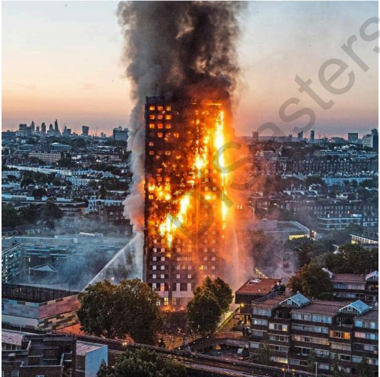
Figura 5.46. Incendio della Grenfell Tower.

temporanei, cibo, assistenza medica e servizi di consulenza. Le conseguenze dell'incendio della Grenfell Tower hanno sottolineato l'importanza di una risposta umanitaria rapida e globale per affrontare i bisogni immediati delle persone colpite dal disastro.