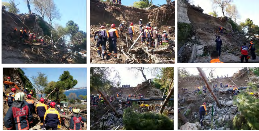
Şekil 2. Türkiye'de 2023 yılında heyelan sonrası müdahale çalışmaları

Heyelanlar, sele nazaran genellikle daha küçük alanları etkilerken, ciddi ölümlere ve mali kayıplara neden olmaktadır. Nüfus artışı ve dağlık bölgelerdeki hassas eğimli arazilerde veya yakınlardaki kontrolsüz yerleşimler sonucunda son yıllarda heyelan olayları ve bunun insan yaşamına ve çeşitli mülklere olan etkisi artmaktadır. Heyelana yol açan doğal sebeplerden bazılarında yağış, eğim, zayıf zemin ve deprem verilebilir. Bunun yanında insan kökenli sebeplerden de heyelan meydana gelebilmektedir. Yamaçlarda ormanların tahrip edilmesi, eğimli arazilere, riskli alanlara yerleşme (fazla nüfus ve mevcut yerleşim yeri azlığından, mali problemlerden), drenaj kanallarının bakımının iyi yapılmaması, su bertarafındaki yetersizlikler gibi nedenlerden dolayı da heyelan meydana gelebilmektedir (Kervyn vd., 2015). Zeminlerde meydana gelenlere ilaveten bazı özel saharlarda oluşan heyelanlar da afet oluşturabilmektedir (Toprak vd., 2021)