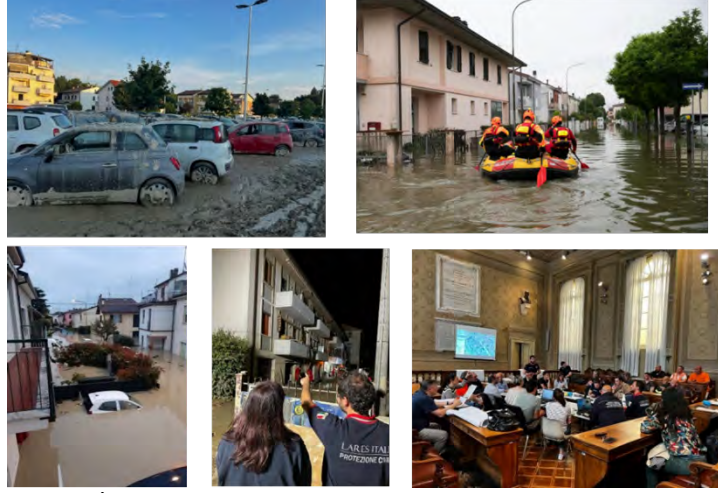
Şekil 1. İtalya'da 2023 yılında taşkın sonrası müdahale çalışmaları